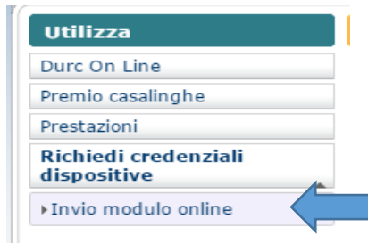
FIG. 4 – servizio on line Richiedi Credenziali dispositive – invia modulo