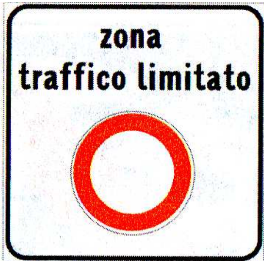
Figura II 322/a Art. 135