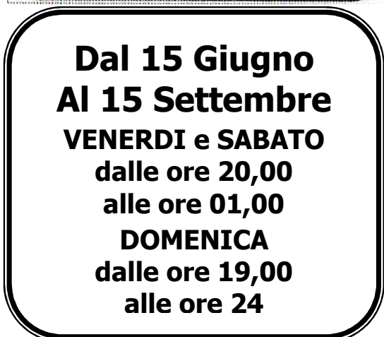
Figura II 321 Art. 135